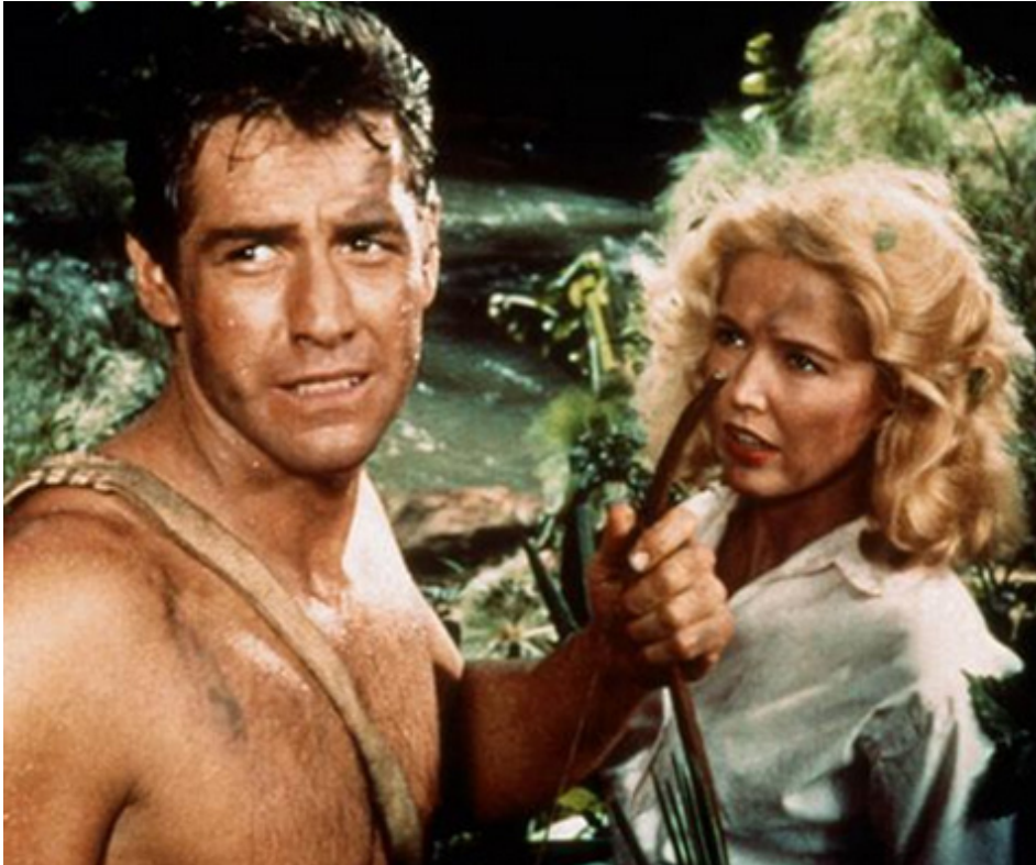
1959 LA PLUS GRANDE AVENTURE DE TARZAN (Tarzan's greatest Adventure) de John Guillermin avec Eve Brent