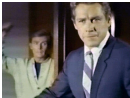
1966 LE RAYON INFERNAL (Il raggio infernale) de Gianfranco Baldanello avec Max Dean