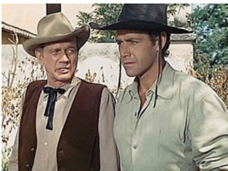
1965 LES FORCENÉS (Gli uomini dal passo pesante) d'Albert Band & Mario Sequi avec Joseph Cotten