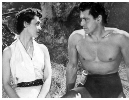
1955 TARZAN ET LE SAFARI PERDU (Tarzan and the Lost Safari) d'H. B. Humberstone avec Betta St. John