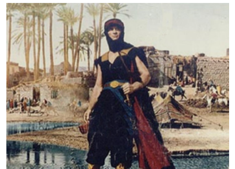
1964 LE FILS DU SHEIK (Karim Ebn el Cheikh) de Mario Costa