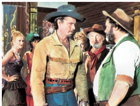
1964 BUFFALO BILL, LE HÉROS DU FAR WEST (Buffalo Bill) de Mario Costa avec O. Pevarello