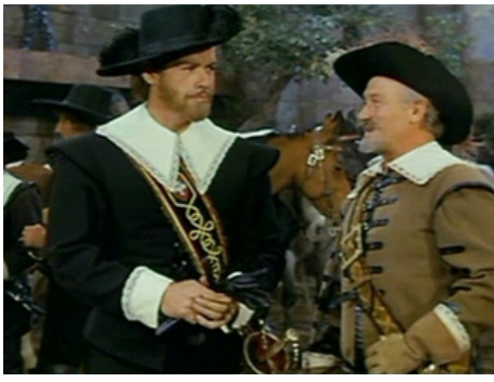
1962 ZORRO ET LES 3 MOUSQUETAIRES (Zorro è i tre moschiettieri) de L. Capuano avec Nerlo Bernardi