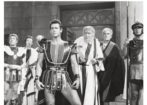
1963 LA TERREUR DES GLADIATEURS (Coriolano, eroe senza patria) de G. Ferroni avec Nerlo Bernardi