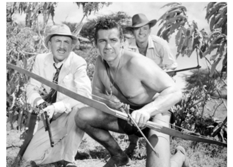
1960 TARZAN LE MAGNIFIQUE (Tarzan the Magnificent) de Robert Day avec Lionel Jeffries, Ch. Bud Tiggwell