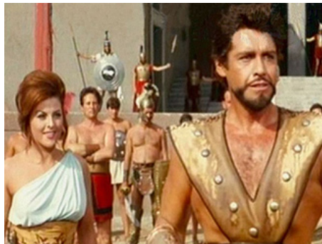
1963 HERCULE CONTRE MOLOCH (Erocle contro Moloch) de Giorgio Ferroni avec Rosalba Neri