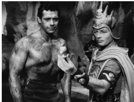
1961 MACISTE CONTRE LE FANTÔME (Maciste contro il Vampiro) de G. Gentilomo avec Jacques Sernas