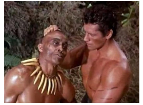
1958 LE COMBAT MORTEL DE TARZAN ( Tarzan's Fight for Life) d'H. B. Humberstone avec W. Strode