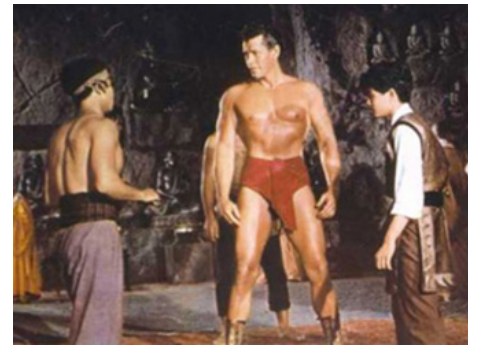
1961 LE GÉANT À LA COUR DE KUBLAÏ KHAN (Maciste alla corte del gran Khan) de Riccardo Freda