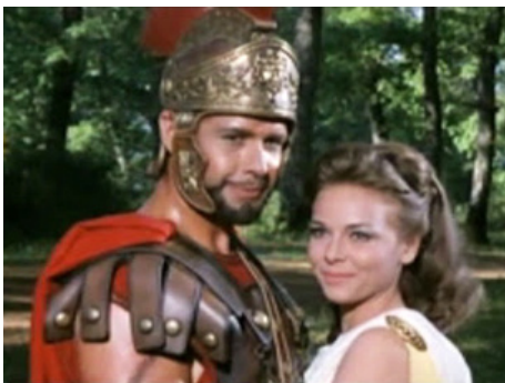
1964 LE COLOSSE DE ROME (Il colosso di Roma) de Giorgio Ferroni avec Gabriella Pallotta