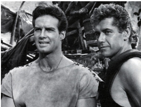
1961 ROMULUS ET REMUS (Romolo e Remo) de Sergio Corbucci avec Steve Reeves