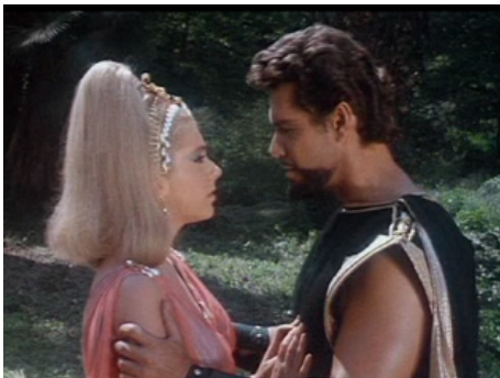
1963 GOLIATH ET L'HERCULE NOIR (Golia e la schiava ribelle) de Mario Caiano avec Gloria Milland