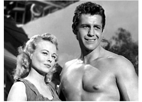
1958 TARZAN ET LES TRAPPEURS (Tarzan and the Trappers) de Charles F. Haas avec Eve Brent